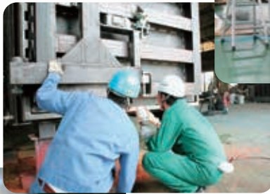
労働局による缶体検査