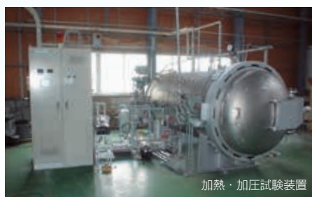
加熱・加圧試験装置

弊社工場内に試験機を常設。 複合材料の加熱硬化試験や合わせガラスの 評価試験等各種の加熱・加圧試験にご利用いただけます。